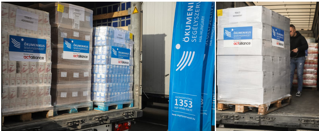
Erste Hilfsgüter werden von Ungarn in den Süden der Ukraine gebracht.

Die Partnerorganisation der Diakonie Katastrophenhilfe, Hungarian Interchurch Aid (HiA), hat bereits am Samstag zwei Lastwagen mit Hilfsgütern für die Ukraine auf den Weg gebracht, um dort Flüchtlinge zu unterstützen. Insgesamt 28 Tonnen Lebensmittel wie Konserven, Mehl, Zucker, Öl, Reis, Nudeln, Kekse, H-Milch, Tee und Hygieneartikel sind Teil des Transports. Ziel sind die Zentren Beregszász und Uzhhorod im Grenzgebiet zu Ungarn im Südwesten der Ukraine. Die Waren werden an Familien verteilt, die aufgrund des Krieges aus ihrer Heimat fliehen mussten.